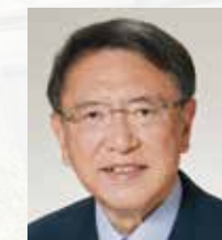
丹羽雄哉氏 衆議院議員 元厚生大臣 元自由民主党総務会長