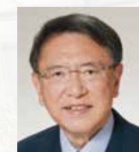
丹羽雄哉氏 衆議院議員 元厚生大臣 元自由民主党総務会長